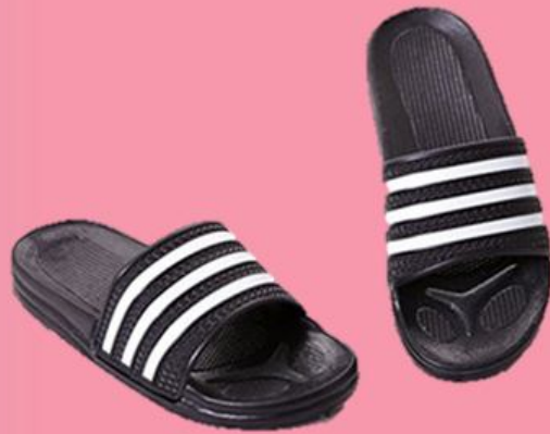
바자회물품 (실내화 등)